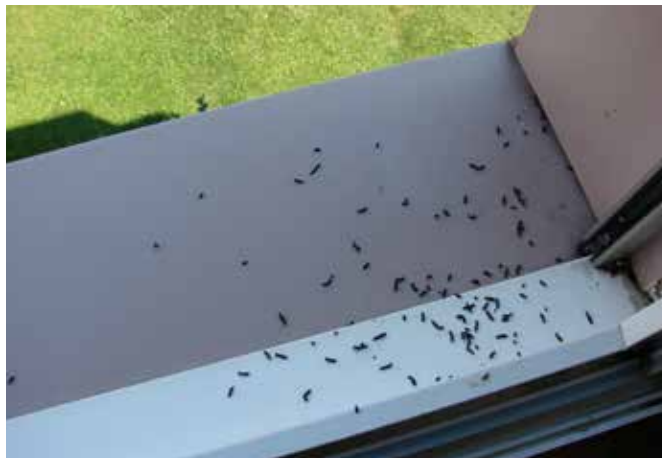
Les crottes étant sèches, elles peuvent être facilement balayées du bord de fenêtre.