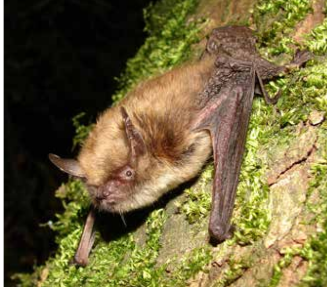
Murin à moustaches

L'association Chiroptera Neuchâtel – CCO est l'organisme officiel chargé par le Service de la Faune, des Forêts et de la Nature du Canton de Neuchâtel de la conservation des espèces de chiroptères vivant sur son territoire, en application de la loi fédérale sur la protection de la nature et du paysage (LPN) de 1966 et de la Convention de Berne.