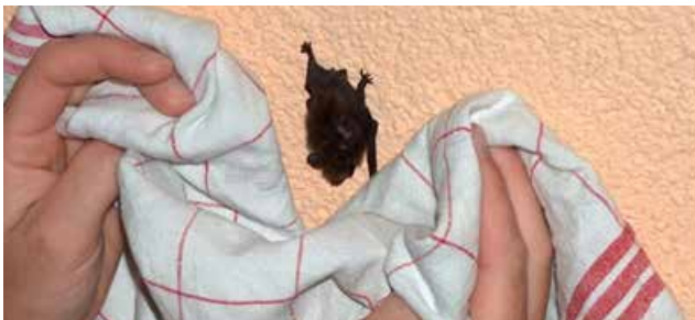
Ne touchez pas les chauves-souris à mains nues

N'hésitez pas à nous contacter pour demander de l'aide !