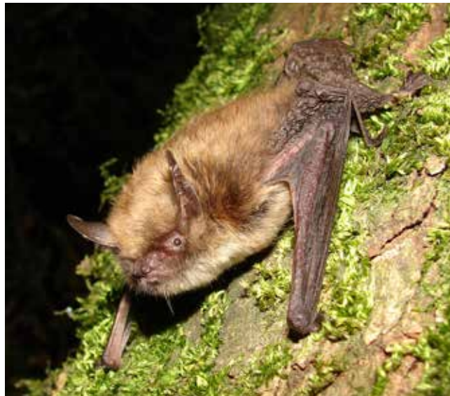
Murin à moustaches

L'association Chiroptera Neuchâtel – CCO est l'organisme officiel chargé par le Service de la Faune, des Forêts et de la Nature du Canton de Neuchâtel de la conservation des espèces de chiroptères vivant sur son territoire, en application de la loi fédérale sur la protection de la nature et du paysage (LPN) de 1966 et de la Convention de Berne.