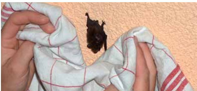
Ne touchez pas les chauves-souris à mains nues

N'hésitez pas à nous contacter pour demander de l'aide !